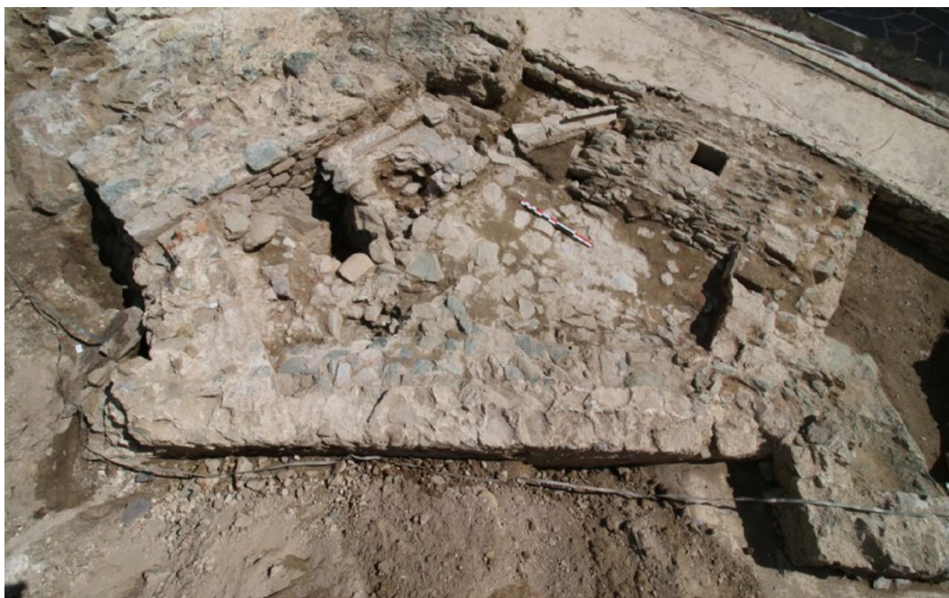
Fouilles archéologique au nid d'aigle, © Arkemine

Ainsi, cette opération illustre pleinement le rôle de l'archéologie préventive comme outil de connaissance, de transmission et de valorisation du patrimoine, au service d'un projet culturel ambitieux pour la Citadelle de Corti.