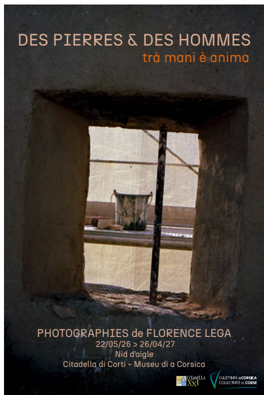
PHOTOGRAPHIES de FLORENCE LEGA 22/05/26 > 26/04/27 Nid d'aigle Citadella di Corti - Museu di a Corsica

De courts extraits de ses lectures accompagnent chaque photo et font ainsi résonner l'image avec le texte ; l'exposition est pensée comme une déambulation sensible et poétique. Parallèlement, elle enseigne les Arts Appliqués et prolonge ainsi son envie de transmettre et de valoriser les métiers d'art qui participent à sauvegarder la richesse du patrimoine.