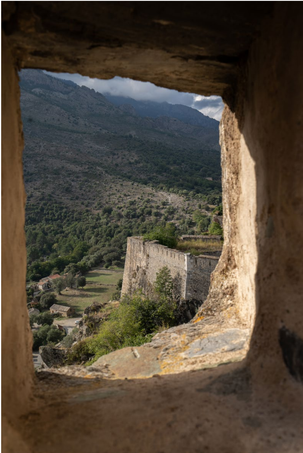
Détail meurtrière, citadelle de Corti